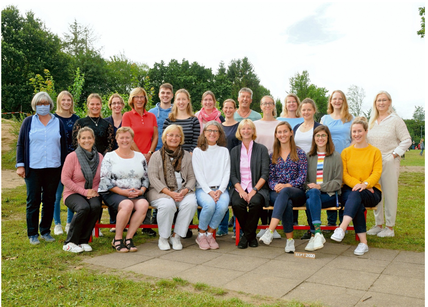
Unser Kollegium im Herbst 2020

Auch die Elternschaft ist natürlich ein wichtiger Teil der Schulgemeinschaft - viele Eltern tragen durch die aktive Unterstützung verschiedener Schulveranstaltungen zur Gestaltung eines lebendigen Schullebens bei.