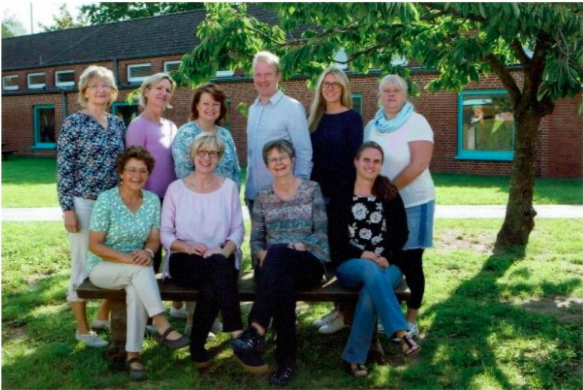
Das Team der OGS im Herbst 2020.

Derzeit nutzen 155 Schülerinnen und Schüler unser offenes Ganztagsangebot.